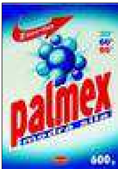
Obr. 1: Palmex modrá síla

Největší prodej se předpokládá u pracího prášku Palmex modrá síla, který bude v 1. pololetí 2008 novinkou, kterou firma uvede na trh. Z tohoto důvodu byla zahájena velká reklamní kampaň, aby se tento produkt dostal do povědomí zákazníků.